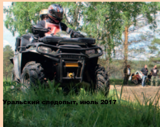
Уральский следопыт, июль 2017